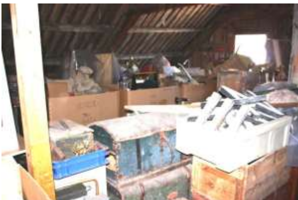
En stor del av museets samlinger oppbevares på loftet.