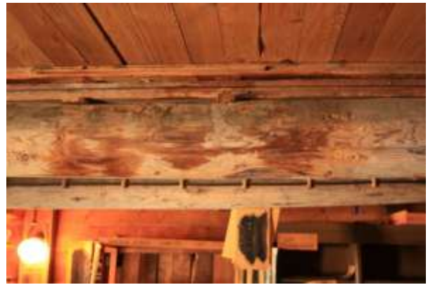
På en av golvåsene er det spor etter en gammel fukt/råteskade og en tidligere understøtte er fjernet.