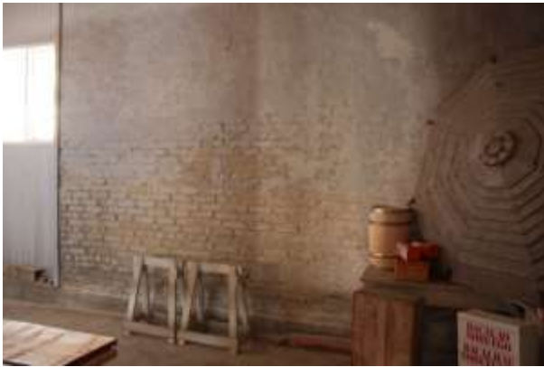
Murvegg mot øst i vaskehallen har en del skade i pussen.