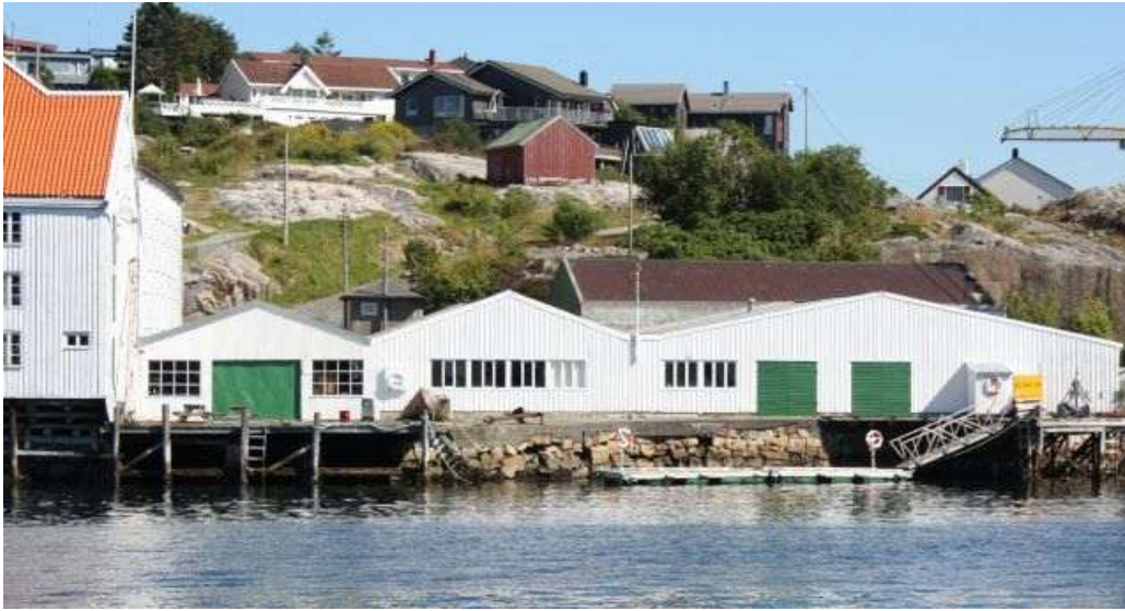
Vaskehallen med flytekai i forkant.