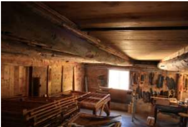
Det er stor belastning på golvåsene i 4. etasje pga. lagring av mange gjenstander på loftet.