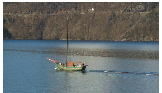
På tur med ny mast på slep

I nydeleg vår la jekta vår «Brødrene av Sand» ut frå kaien på Eide, Sand. Turen gjekk til sluppen på Avaldsnes, der ho vart gjort klar til sesongen. Den nye masta vart tatt på slep bak båten, og skal gjerast ferdig hos Ryfylke trebåtbyggjeri på Finnøy.